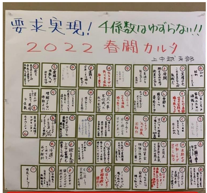
上中越支部春闘カルタ