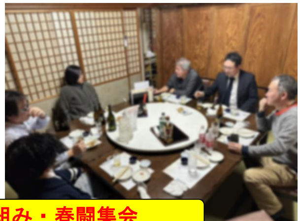
上中越支部春闘の取り組み・春闘集会