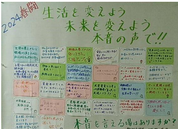
新潟新幹線運輸区の取り組み