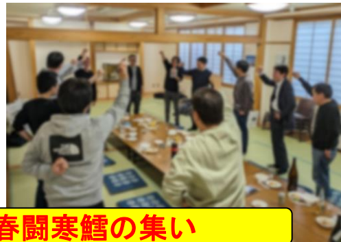
酒田地区分会春闘寒鱈の集い